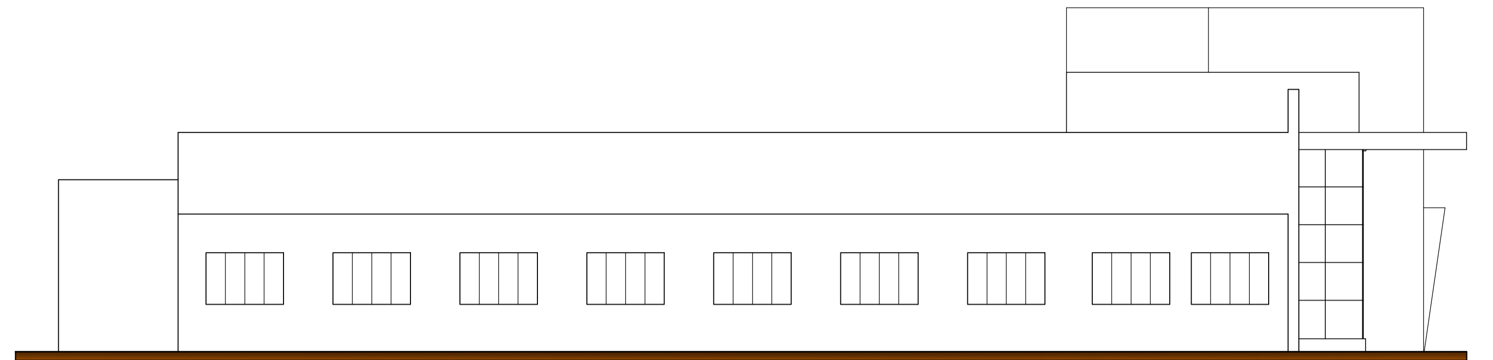
VISTA 02 ESC.: 1 / 75 M